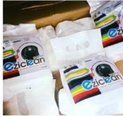
Caption : Antara produk yang dijual oleh Puan Noraini menerusi Media Sosial Facebook dan Instagram